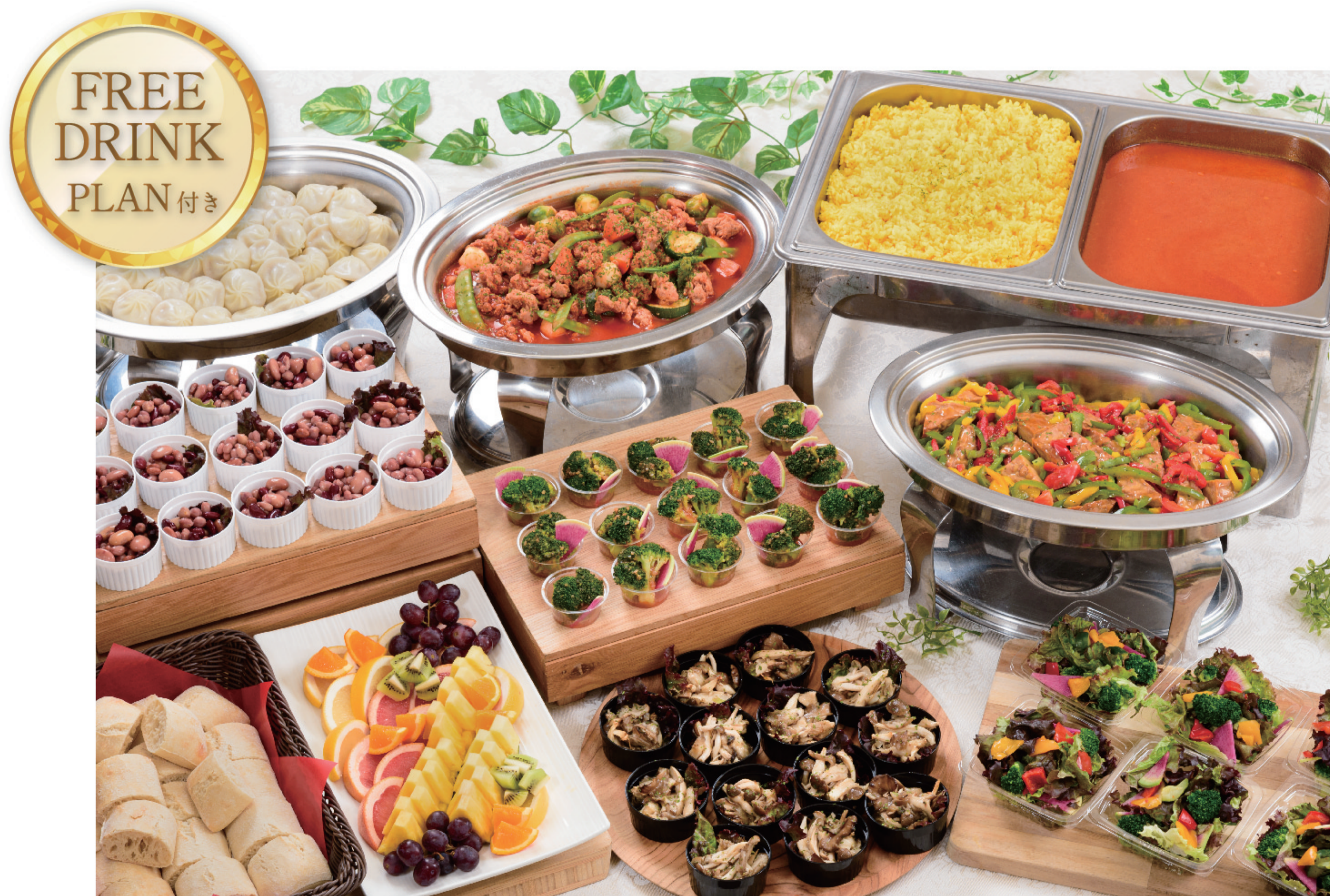
VEGAN VEGETARIAN PLAN