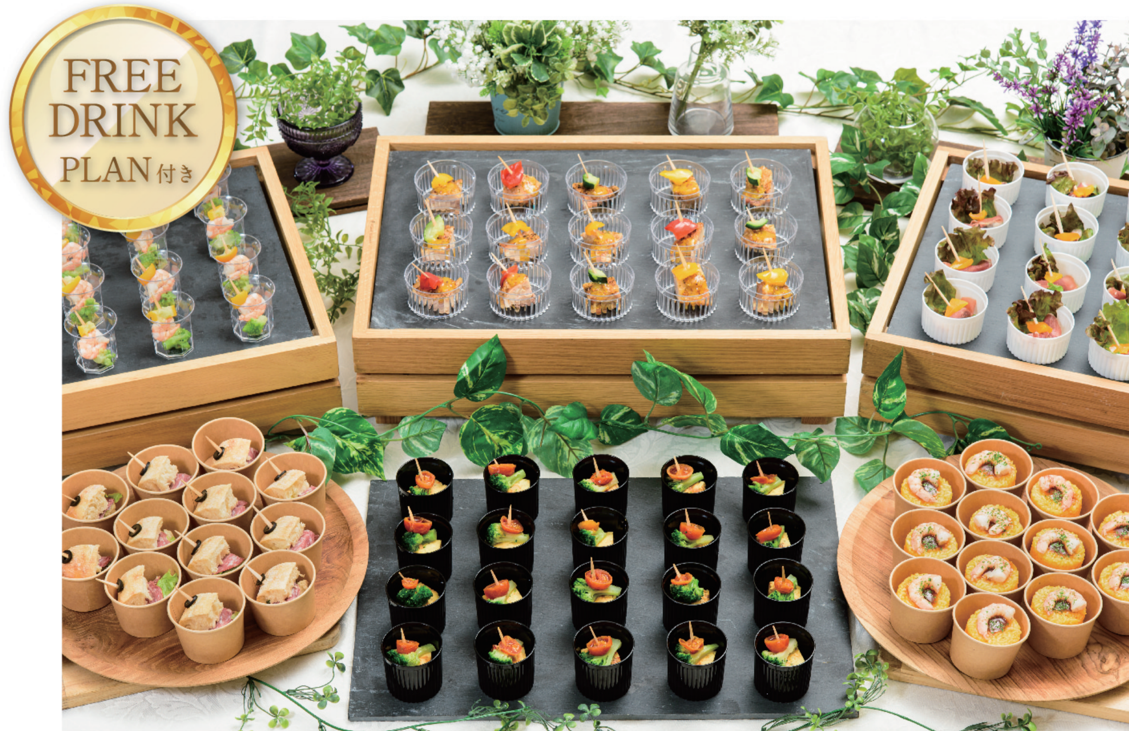
FINGERFOOD PLAN - LIGHT-