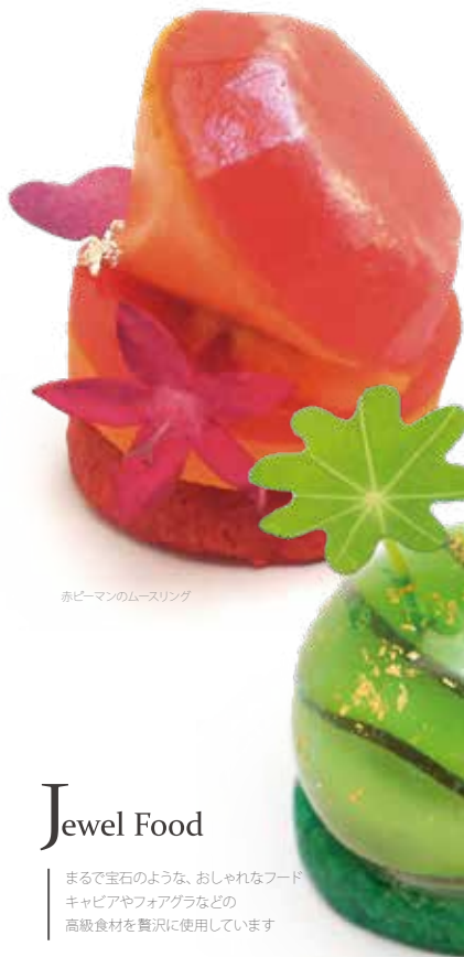
赤ピーマンのムーズリング